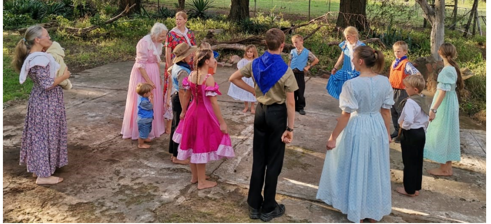
Jonk en oud doen saam volkspele in die opelug by Boekenhoutspoort te Alma

drag te kry of te maak en te dra om sigbaar ons volk te verenig in ons kultuurerfenis.